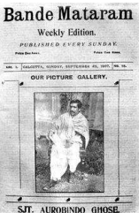
“ವಂದೇ ಮಾತರಮ್ ಘೋಷ” 2

4. ನಾಗಪೂರದಿಂದ ಸೂರತಕ್ಕೆ ಸಭೆ; ನ್ಯಾಷನಲ್ ಕಾಂಗ್ರೆಸ್ ಪಕ್ಷವು ಪ್ರಪ್ರಥಮವಾಗಿ ವಿಭಜನೆಗೊಂಡ ಘಟನೆ ಇದಾಗಿದೆ. 1907 ನೇ ಇಸ್ವಿಯ ಈ ಸೂರತ್ ಸಭೆಯಿಂದ ಕಾಂಗ್ರೆಸ್ ಪಕ್ಷವು ಇಬ್ಭಾಗವಾಯಿತು. ಇದನ್ನು ಬಳಸಿಕೊಂಡ ಬ್ರಿಟೀಶರು ಮುಸಲ್ಮಾನ ಸಮುದಾಯಕ್ಕೆ ಸಹಾಯಕವಾಗಿದ್ದುದರಿಂದ ಮುಂದೆ ಮಹಮ್ಮದ ಅಲಿ ಜಿನ್ನಾರಿಂದ “ಮುಸ್ಲಿಂ ಲೀಗ್” ನಿಂದಾಗಿ ಮತ್ತೊಮ್ಮೆ ವಿಭಜನೆಗೊಂಡಿತು.