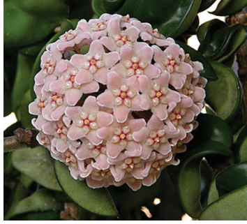
ಸಾಮೂಹಿಕ ಅಭೀಪ್ಸೆಯ ಸಾಮರ್ಥ್ಯ

ಸಾಮರಸ್ಯದಿಂದ ಕೂಡಿದ ಸಾಮೂಹಿಕ ಅಭೀಪ್ಸೆ ಪರಿಸ್ಥಿತಿಗಳ ಮುನ್ನಡೆ (course)ಯನ್ನು ಬದಲು ಮಾಡಬಲ್ಲದು