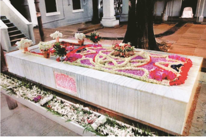
(ಸಮಾಧಿಯತ್ತ ನೋಡುತ್ತಿರುವಾಗ ಶ್ರೀಮಾತೆಯವರು ಹೇಳಿದ್ದು)

ನಾನು ಪೂಜೆಗೊಳ್ಳಲು ಬಯಸುವುದಿಲ್ಲ. ನಾನು ಕಾರ್ಯ ಕೈಕೊಳ್ಳಲು ಬಂದಿದ್ದೇನೆ, ಪೂಜೆ ಮಾಡಿಸಿಕೊಳ್ಳುವುದಕ್ಕಲ್ಲ. ಅವರು ನಿಮ್ಮನ್ನು (ಶ್ರೀ ಅರವಿಂದರನ್ನು) ತಮ್ಮ ಹೃದಯ ತೃಪ್ತಿಗೊಳ್ಳುವವರೆಗೆ ಪೂಜೆ ಮಾಡಲಿ, ಕ್ಷೋಭೆಗೊಳಗಾಗದಂತೆ ನಾನು ನಿಶ್ಚಲನೀರವತೆಯಲ್ಲಿರಲು ಹಾಗೂ ಅಡಗಿರಲು ನನ್ನನ್ನು ಬಿಟ್ಟುಕೊಡಲಿ, ಎಲ್ಲ ಪರದೆಗಳಲ್ಲಿ ದೇಹ ಅತ್ಯಂತ ಒಳ್ಳೆಯ ಪರದೆಯಾಗಿದೆ.